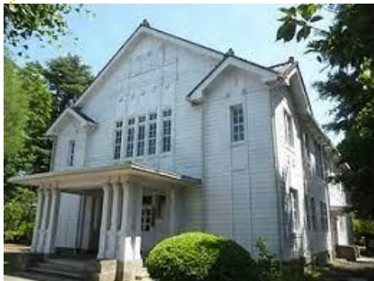
宇都宮大学 峰が丘講堂

国道123号線を挟んで 宇都宮大学峰が丘講堂 の向かい側にあるビル の2階に仮設診療所が あります。